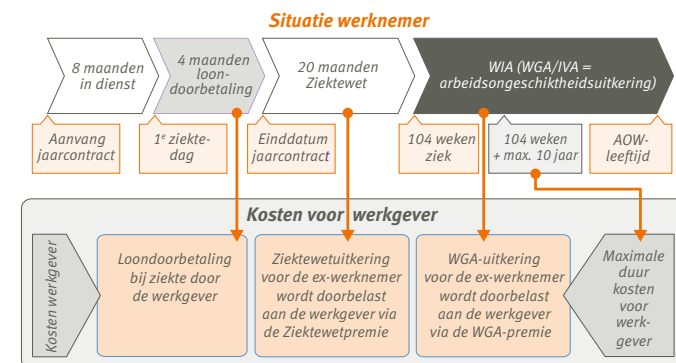
Voobeeldsituatie bij UWV: werknemer met een jaarcontract die na 8 maanden ziek wordt.

Maar er is een alternatief: voor deze ex-werknemers kunt u eigenrisicodrager voor de Ziektewet worden.